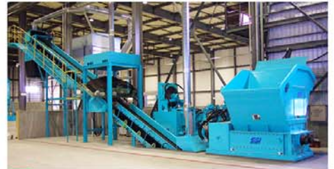
2軸破碎機による廃棄物の破碎